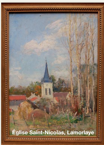
Église Saint-Nicolas, Lamorlaye