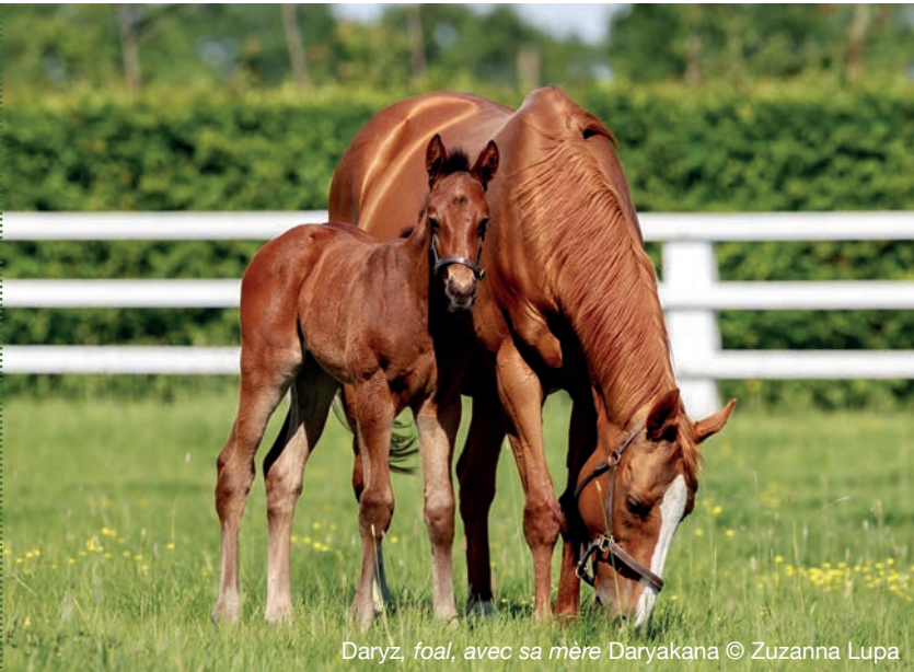
Daryz, foal, avec sa mère Daryakana