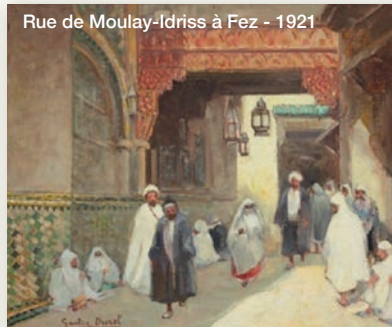
Rue de Moulay-Idriss à Fez - 1921

Hostellerie du Lys, Forêt du Lys-Chantilly, par Lamorlaye (Oise) - Tél. 19